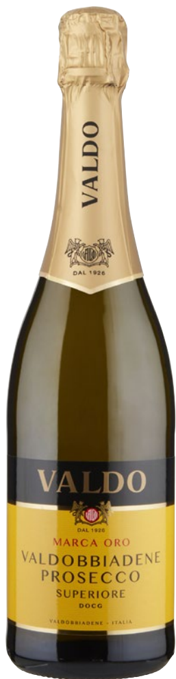
VALDO Prosecco Superiore Oro DOCG cl 75