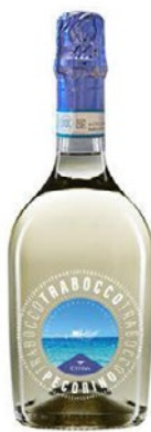
CITRA Spumante pecorino trabocco cl 75