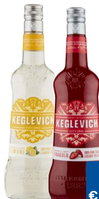
KEGLEVICH Vodka frutta assortita cl 70