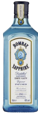
BOMBAY SAPHIRE Sapphire Gin cl 70