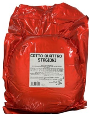
PROSCIUTTO COTTO 4 STAGIONI al kg

*I PREZZI PRESENTI A VOLANTINO NON SONO VALIDI PER IL SERVIZIO DI CONSEGNA