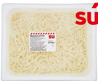
SÙ Mozzarella Tagliata alla Julienne kg 2.5