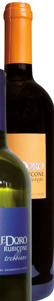
SOLEDORO Sangiovese/ Trebiano Rubicone IGT cl 75