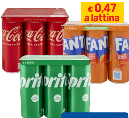
COCACOLA, FANTA, SPRITE 6 latt x cl 33