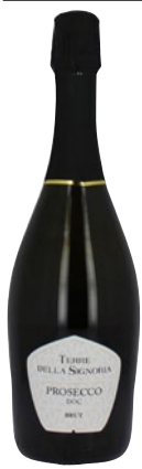
TERRE DELLA SIGNORIA Prosecco Brut DOC cl 75