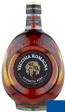
VECCHIA ROMAGNA Etichetta Nera cl 70