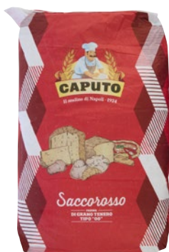
CAPUTO Saccorosso farina di grano tenero tipo "00" kg 25