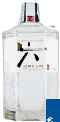
ROKU Gin Japanese cl 70