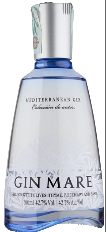
GIN MARE Mediterranean Gin cl 70