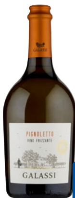
GALASSI Pignoletto Frizzante Emilia-Romagna DOC cl 75