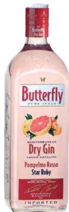
BUTTERFLY Gin Pomelmo Rosso litri 1